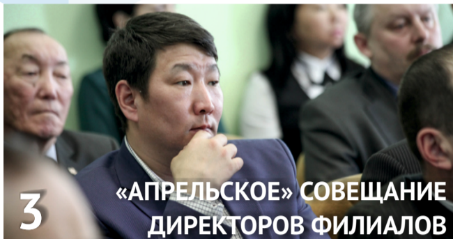
3 «АПРЕЛЬСКОЕ» СОВЕЩАНИЕ ДИРЕКТОРОВ ФИЛИАЛОВ