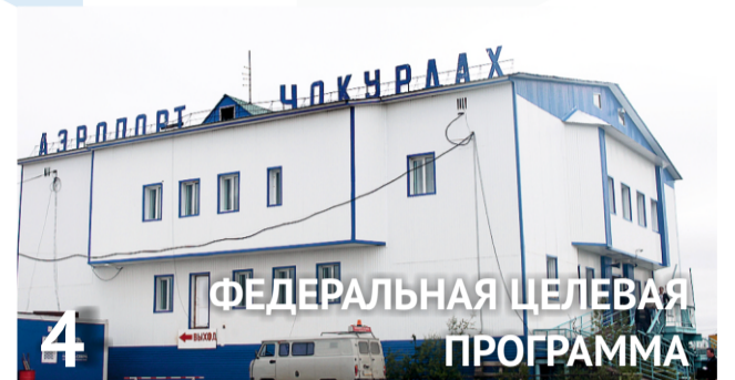
4 ФЕДЕРАЛЬНАЯ ЦЕЛЕВАЯ ПРОГРАММА