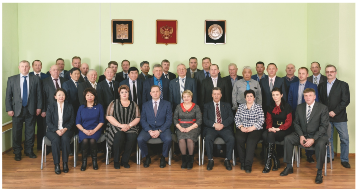
31 марта и 1 апреля 2016 года руководство ФКП «Аэропорты Севера» провело совещание с директорами филиалов по вопросам деятельности предприятия и планах его развития.